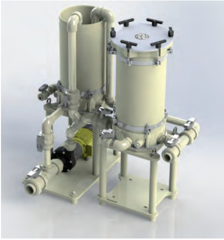
Super Spacesaver mit Anschwemmbehälter

SERFILCO Filter können eine Vielzahl von Filtermedien, einschließlich Kerzen, Scheiben, Beutel, permanenten Medien oder Aktivkohle beinhalten. Die robuste Konstruktion bietet einen geringen Druckverlust für lange Intervalle, kontinuierlichen hohen Durchfluss und lange Lebensdauer.