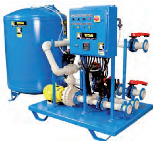
TITAN automatischer Filter

Mit Durchflussraten von 0,5 m 3 /h bis zu 120m 3 /h, Flächen bis zu 44m 2 und einer Vielzahl von Optionen und chemisch beständigen Materialien.