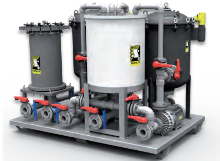
Optiflo mit Anschwemmbehälter und Bypass Aktivkohle

Kontaktieren Sie uns, wir stehen Ihnen beratend zur Seite.