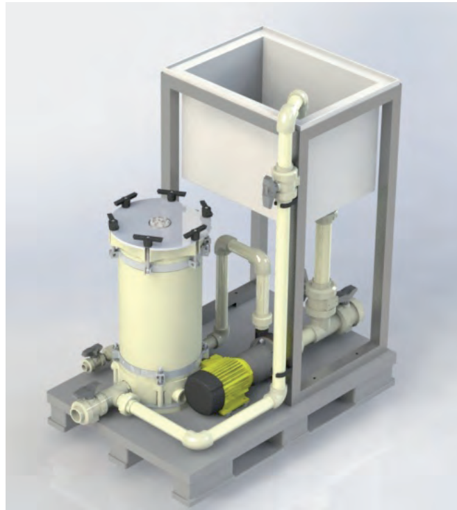
Guardian mit optionalem Anschwemmbehälter

Die Auswahl an verschiedenen Materialien erlaubt den Betrieb mit den meisten Flüssigkeiten, einschließlich aggressiven Chemikalien und hohen Temperaturen.